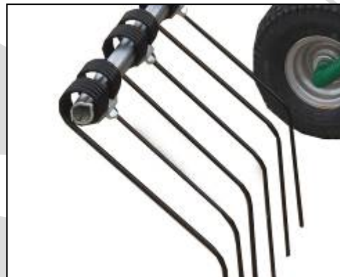
Bracci profilo LIMONE – LEMON'S arms CITRON bras – brazos de LIMON

SERIE ESPECIAL rastrillo con una estructura especialmente robusta, gran ancho de trabajo, posee una notable capacidad de avance, que permite conseguir un elevado rendimiento y una calidad óptima del producto.