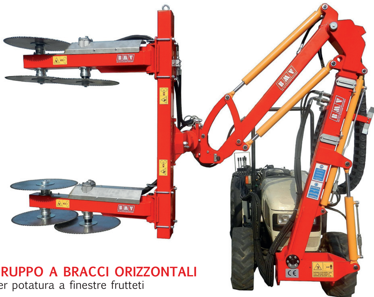
GRUPPO A BRACCI ORIZZONTALI per potatura a finestre frutteti