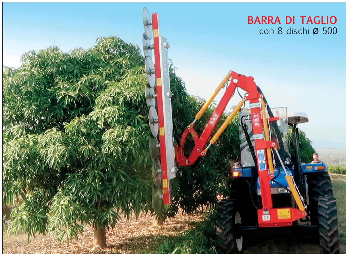
BARRA DI TAGLIO con 8 dischi \varnothing 500