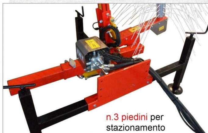
n.3 piedini per stazionamento

Centralina idraulica indipendente da 40 a 80 Lt con gruppo pompa Moltiplicatore Filtro Radiatore per raffreddamento Attacco tre punti