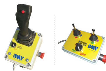
JOYSTICK E SCATOLA COMANDO