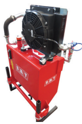
SERBATOIO 40 LT. MOBILE