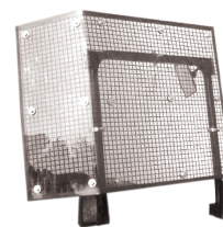
PROTEZIONE RETE + LEXAN