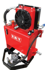
SERBATOIO 40 LT. FISSO