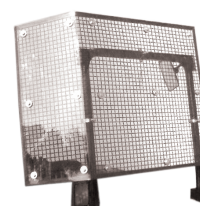
PROTEZIONE RETE + LEXAN