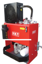
SERBATOIO 80 LT.