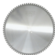
DISCO PER TAGLI A SECCO