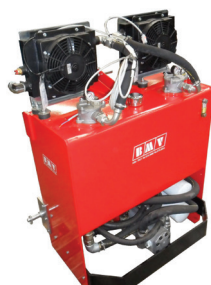
SERBATOIO 120 LT.