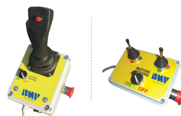
JOYSTICK E SCATOLA COMANDO